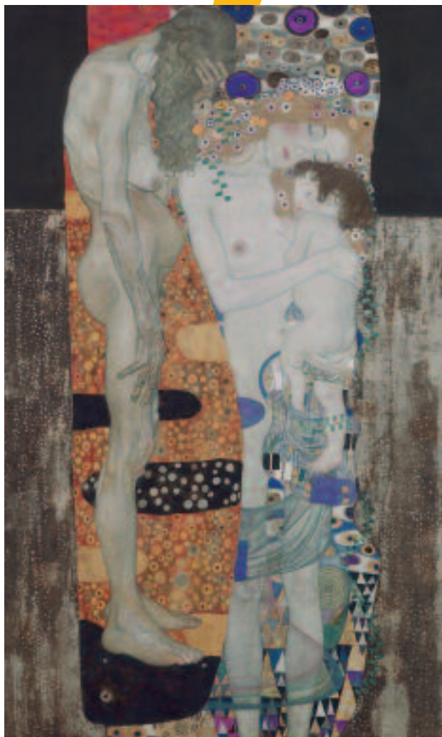
Gustav Klimt Le tre età della vita.